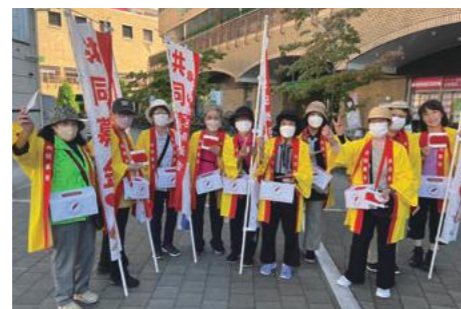
赤い羽根共同募金街頭募金(10月) 吹田地区募金会