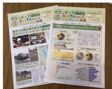
ボランティア情報紙年3回発行