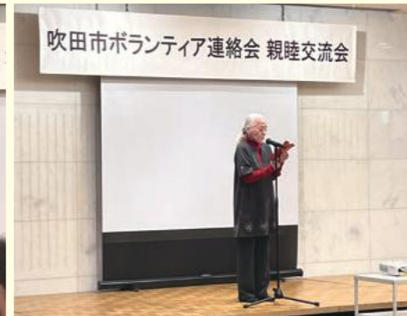
大翔岳風会交子谷支部南千里支部・ボラセン部会(詩吟)