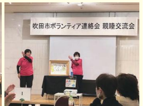
グループあめんぼ(紙芝居・身体ほぐし)