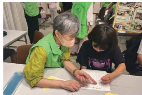
みんなの健康展(9月) 吹田市健康づくり推進事業団・吹田市