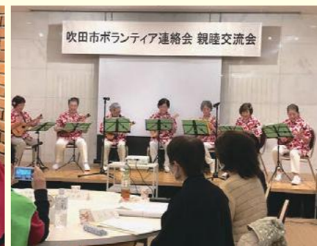
ボランティアグループ「花から」(ウクレレ)