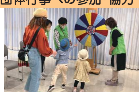
夢のファミリーフェスタ(5月) 吹田市民生・児童委員協議会