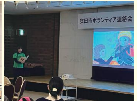
朗読工房(絵本朗読)