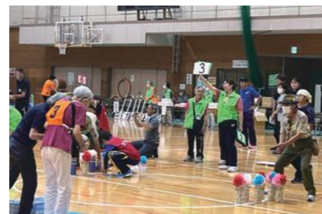
障がい者体育祭(10月) 吹田市障がい者体育祭実行委員会

吹田市ボランティア連絡会(以下ボラ連)はボランティアセンター(以下ボラセン)登録団体の中から任意で集まった24団体で構成され、各グループの枠を超えて協働しています。今号は私たちの活動を一挙ご紹介いたします。