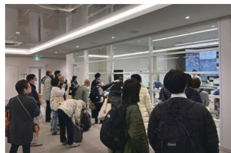
災害支援ネットワーク研修会