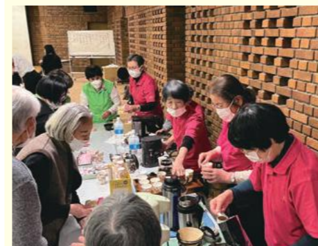
喫茶協力 ボランティアグループ「花から」