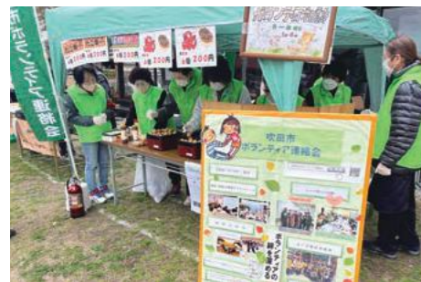
ハートふれあいまつり(3月)