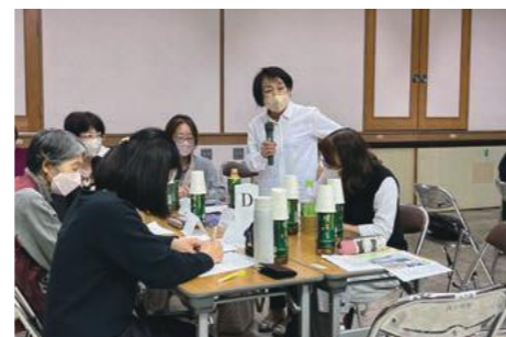
大阪府市町村V連 ブロック交流会