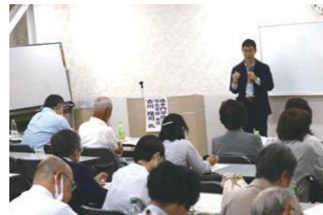
大阪府市町村V連 総会・講演会