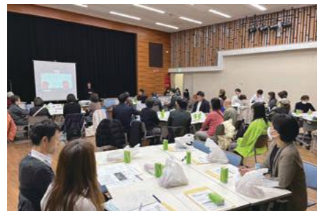
災害支援ネットワーク研修会