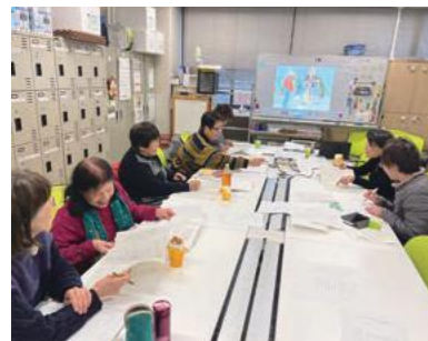
SUITAすまいる編集会議