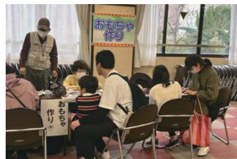
ボランティアセンターまつり(3月) 吹田市社会福祉協議会ボランティアセンター