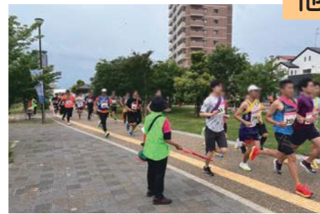
健都リレーマラソン(5月) 吹田マラソン実行委員会