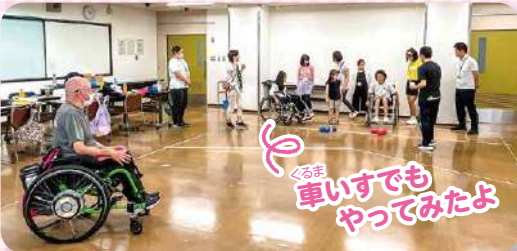
くるま車いすでもやってみたよ